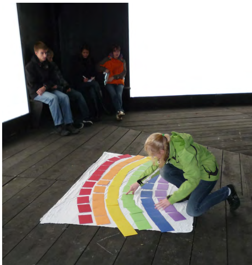
Abschiedsritual: Wir legen einen Regenbogen aus bunten Wunschkarten ...

Wenn Sonne und Regen aufeinander treffen, entsteht neben einem fruchtbaren Klima auch ein Regenbogen. Dieser Regenbogen begleitete uns seit dem Eröffnungswochenende als Motto, verbildlicht er doch wichtige Grundzüge unseres Akademiegedankens: Die mannigfaltigen Facetten der Natur aufmerksam beobachten und wertschätzen – Durch die Teilhabe an einem faszinierenden Gesamtwerk ein Spektrum unterschiedlicher Persönlichkeiten kennenlernen – Sich gemeinsam und doch mit individueller Ausdruckskraft präsentieren.